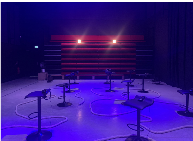
Ateliers Médicis | Clichy-sous-bois