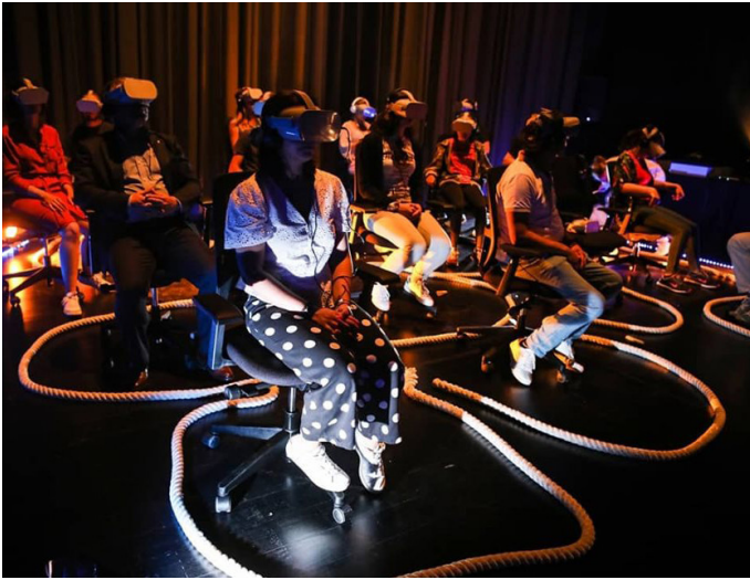
Imaginarium | Festival Internacional de Teatro de Rua (PT)