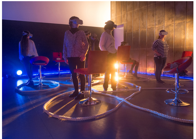
CircoTech | La Grainerie