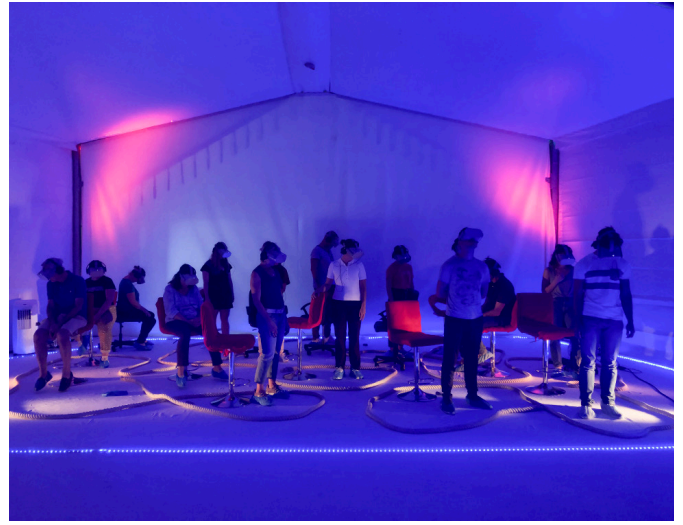
CIAM | Festival Jours et nuits de cirques