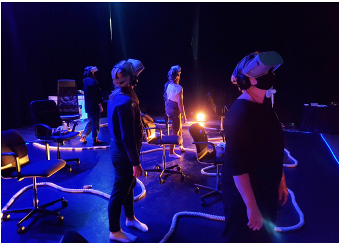
Biennale Internationale des Arts du Cirque